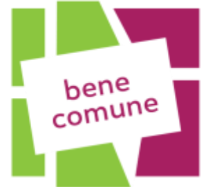
Piazza Caduti della Libertà